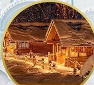
นิงเกิ้ลทอเรส